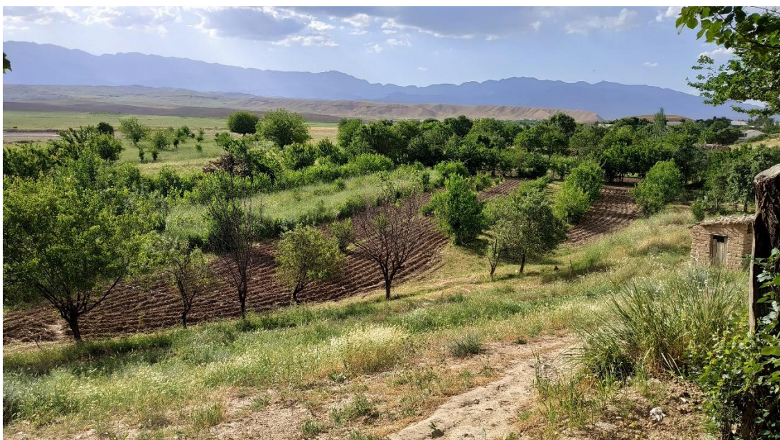
5-rasm. Tog' adirlarda barpo qilingan mevali bog'.

Janubiy hududlar – Surxondaryo va Qashqadaryo va viloyatlarida iqlim sharoitlari keskin kontinental, vegetatsiya davrida havo haroratining yuqori va namligi past bo'lishi o'simliklar holatiga salbiy ta'sir ko'rsatadi. Shimoliy hududlarda esa – Qoraqalpog'iston Respublikasi va Xorazm viloyati o'ziga xos tuproq iqlim sharoitlariga ega. Bu yerda tuproqning va sug'oriladigan suvning turlanishi, qishda havo haroratining juda past bo'lishi mevali ekinlarning navlar majmuasiga kuchli ta'sir ko'rsatadi. Shuning uchun bu hududda sho'rga chidamli, sovuqqa va issiqqa chidamli nav va turlar tanlanishi lozim. Janubiy viloyatlar uchun esa issiqqa, qurg'oqchilikka chidamlilik eng zarur va muhim hisoblanadi.