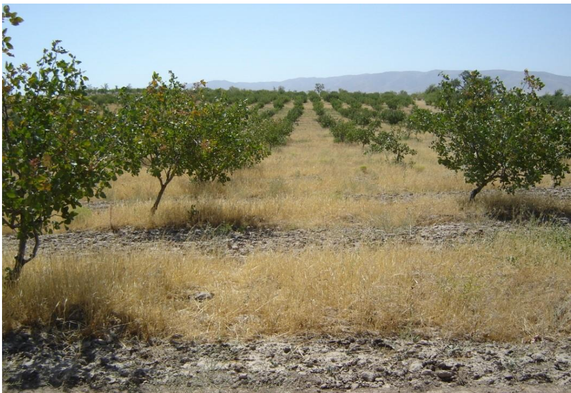
6-rasm. Lalmikor yerlarda barpo qilingan xandon pista plantatsiyasining umumiy ko‘rinishi.

Asrlar davomida xalq seleksionerlari tomonidan mahalliy sharoitlarga moslashgan, qurg‘oqchilikka, tuproq sho‘riga, issiqqa, kasallikka va zararkunandalarga chidamli, meva sifati yuqori bo‘lgan navlar yaratilgan.