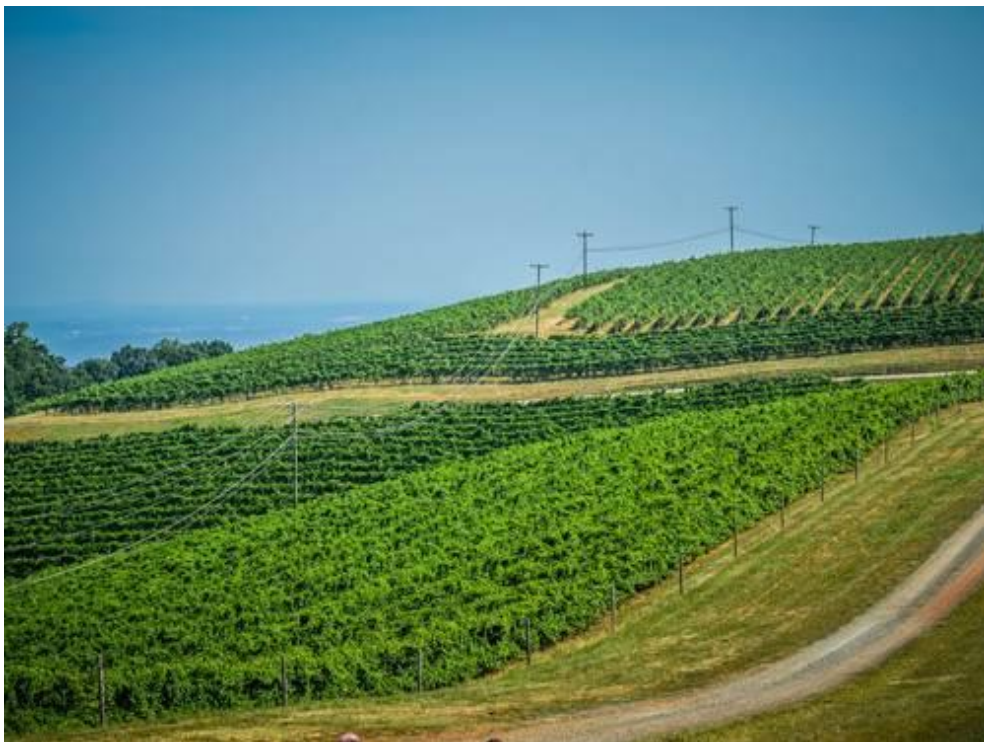
2-rasm. Adir yerlardan unumli foydalanish uchun uzumzorlar barpo qilish.

Ilgari haydalma yer sifatida foydalanib, bir yildan ortiq kuz faslidan boshlab qishloq xo‘jalik ekinlarini ekish uchun foydalanilmayotgan, shuningdek, shudgor qilib qo‘yish uchun ajratilmagan yer turi bo‘z yerlardir. Bunday yerlar mamlakat umumiy yer maydonining 0,2 foizini tashkil etadi.