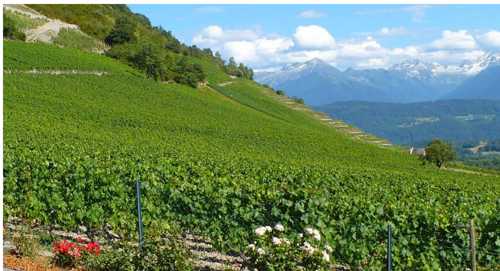
1-rasm. Eroziyaga uchragan adir yerlarda uzumzorlarni barpo qilish.

Haydaladigan yerlar, pichanzorlar, yaylovlar, boʻz yerlar, koʻp yillik daraxtzorlar (bogʻlar, uzumzorlar, tutzorlar va hokazo.) egallagan yerlar qishloq xoʻjaligi yerlari jumlasiga kiradi (1-rasm, 2-rasm).